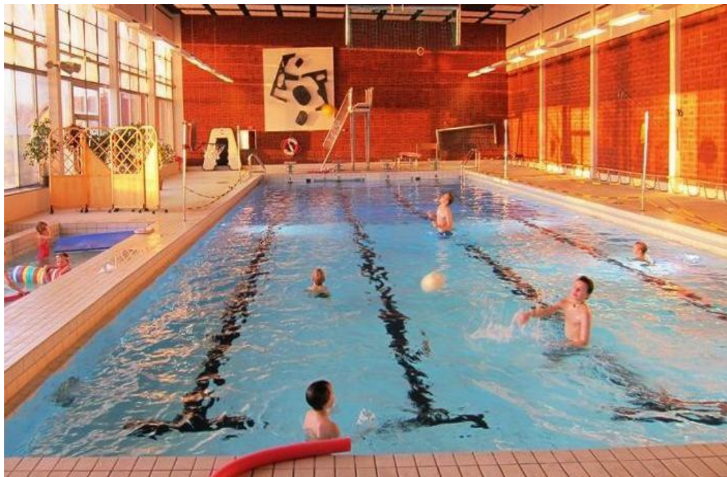
Badhus i Pajala, Junosuando, Tärendö och Korpilombolo