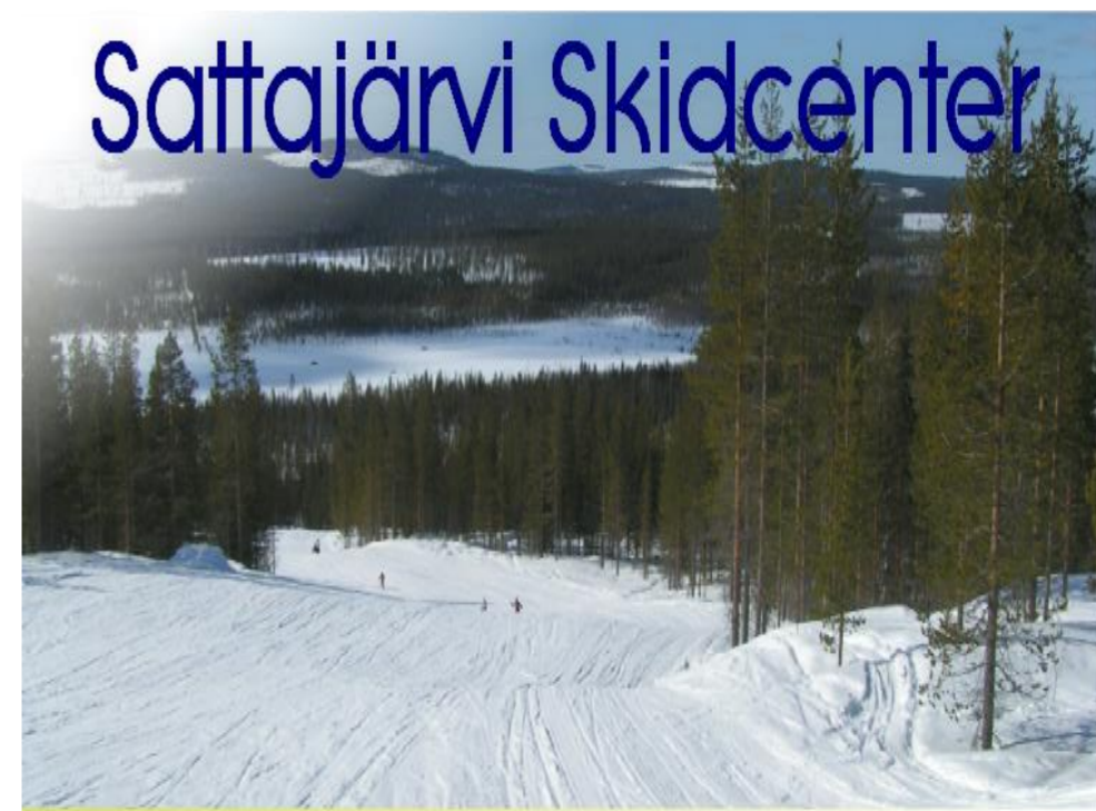
Skidspår i många byar och slalombacke i Sattajärvi