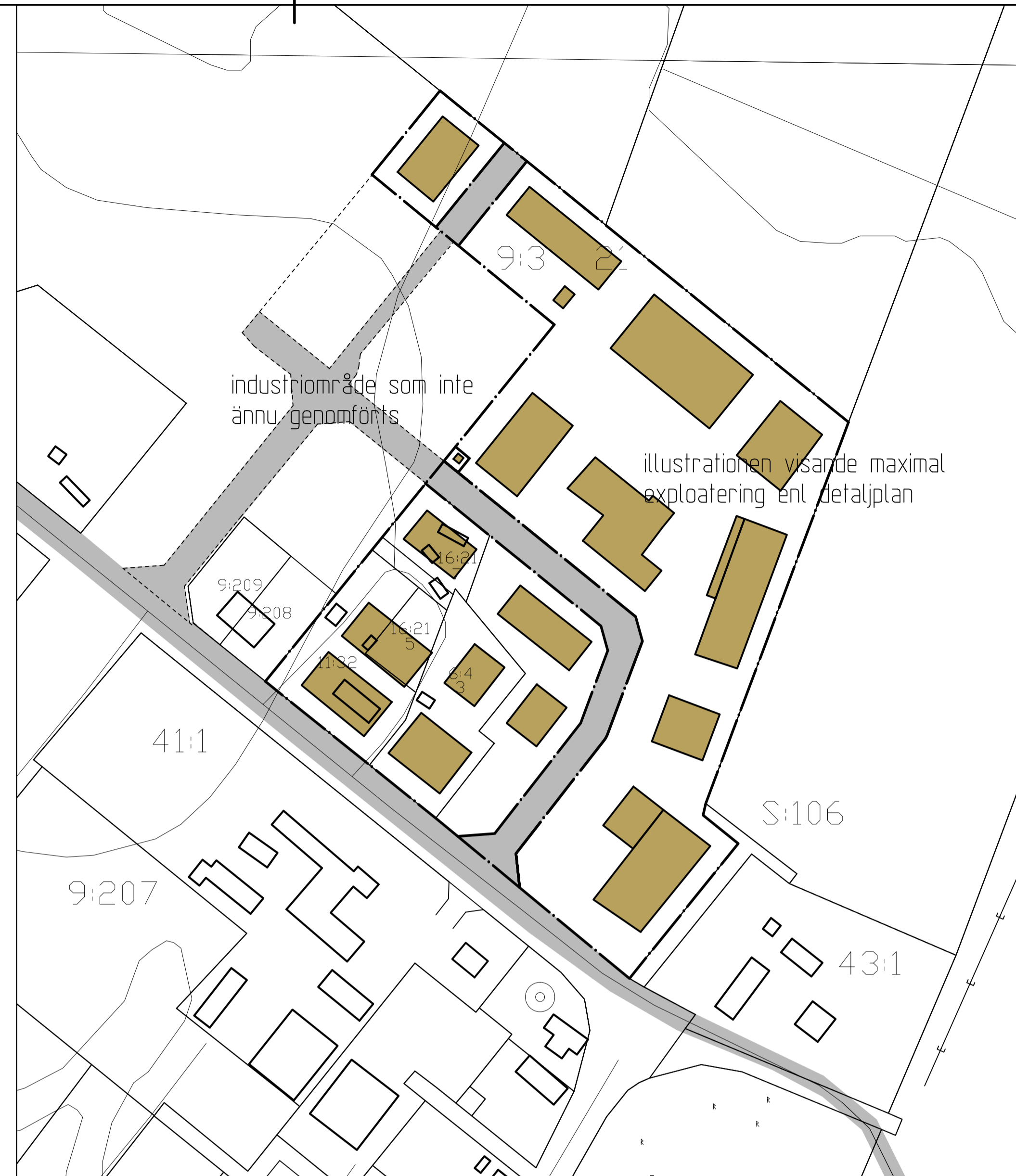
ILLUSTRATION 1:2000 (A1) (30% bebyggda fastigheter)